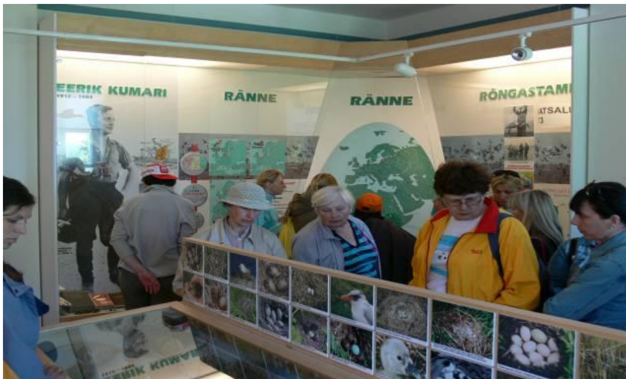
Joonis 5. Ekspositsioon ornitoloogia poolelt ja õpetussõnad info kasutuseks väliõppes