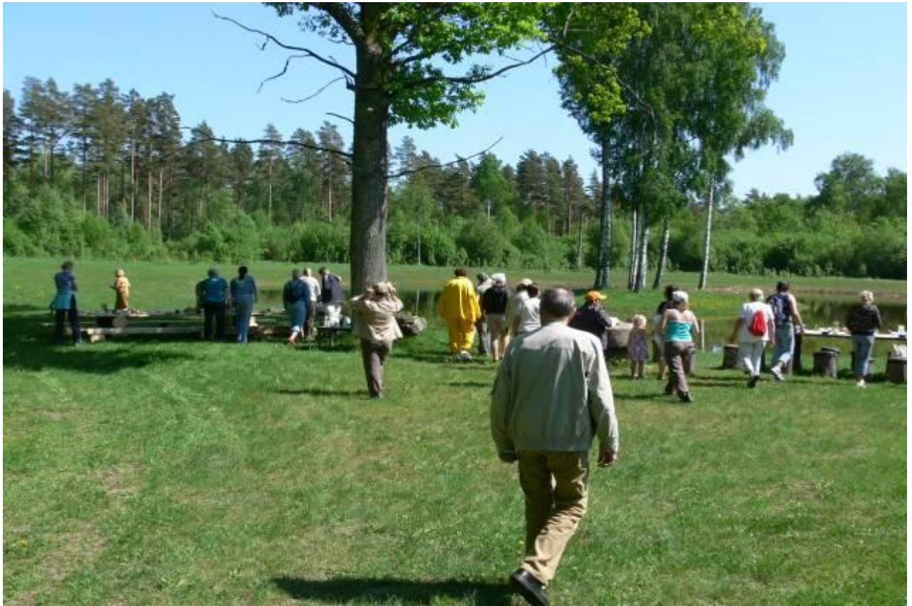
Joonis 13. Tutvumine kohaliku talu maadel oleva rannaniidu ja .....