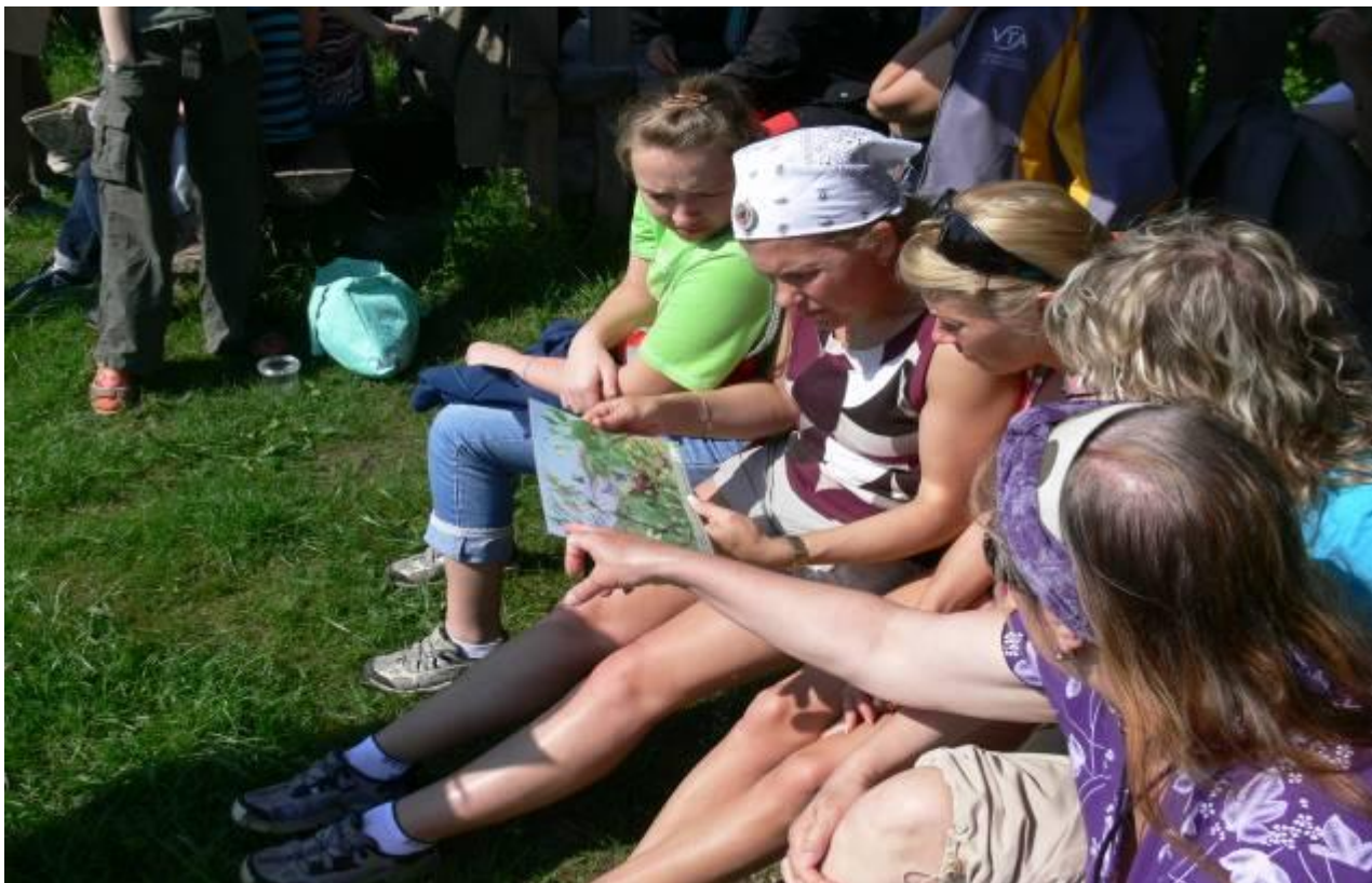
Joonis 15. Näitliku õppematerjali kasutamine