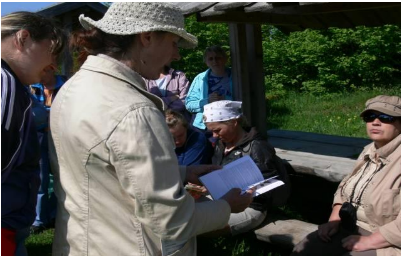
Joonis 18. Näitlik õppematerjal väliõppes raamat – määraja kasutamine