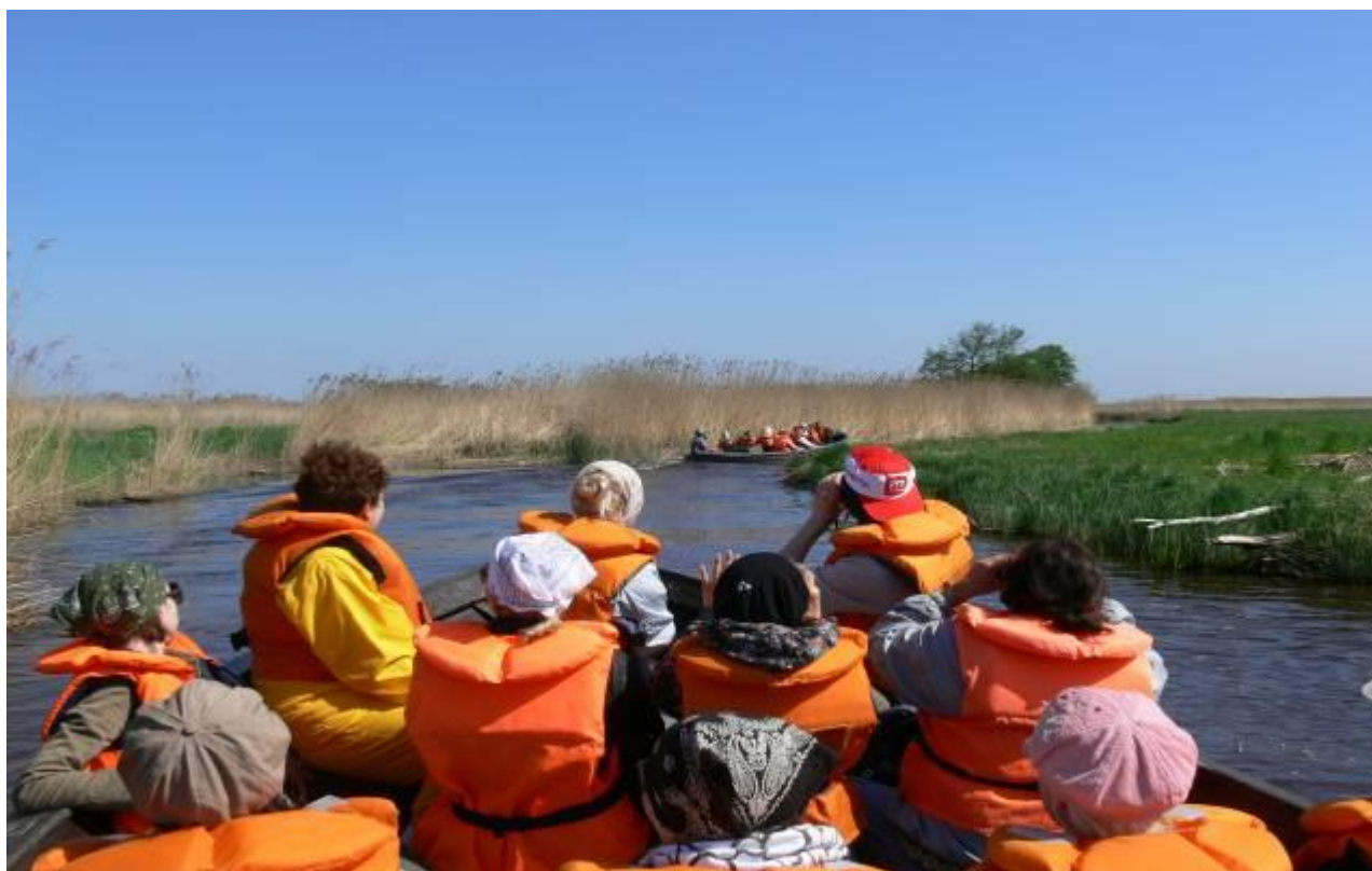
Joonis 6. Väliõpe paadis Suitsu jõel