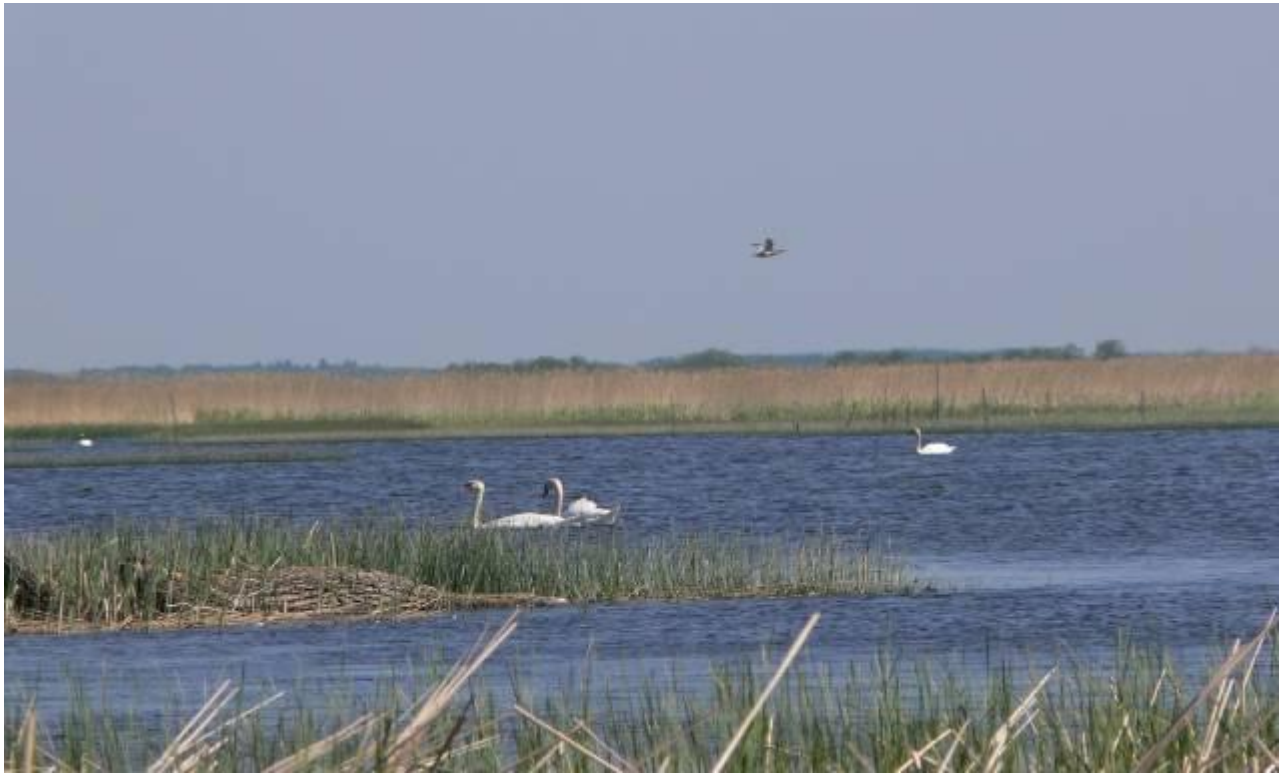
Joonis 11. Matsalu linnuriik