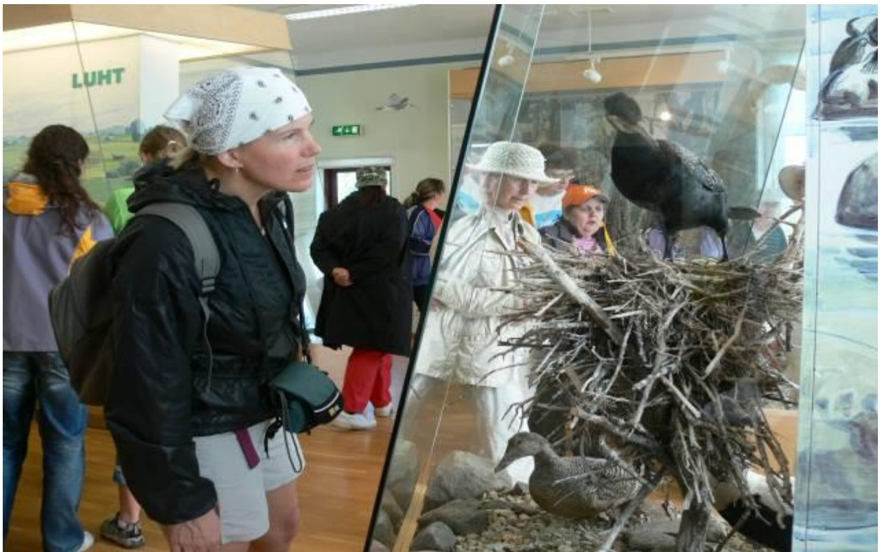
Joonis 4. Tutvumine ekspositsiooniga ning juhtnöörid info kasutuseks väliõppes