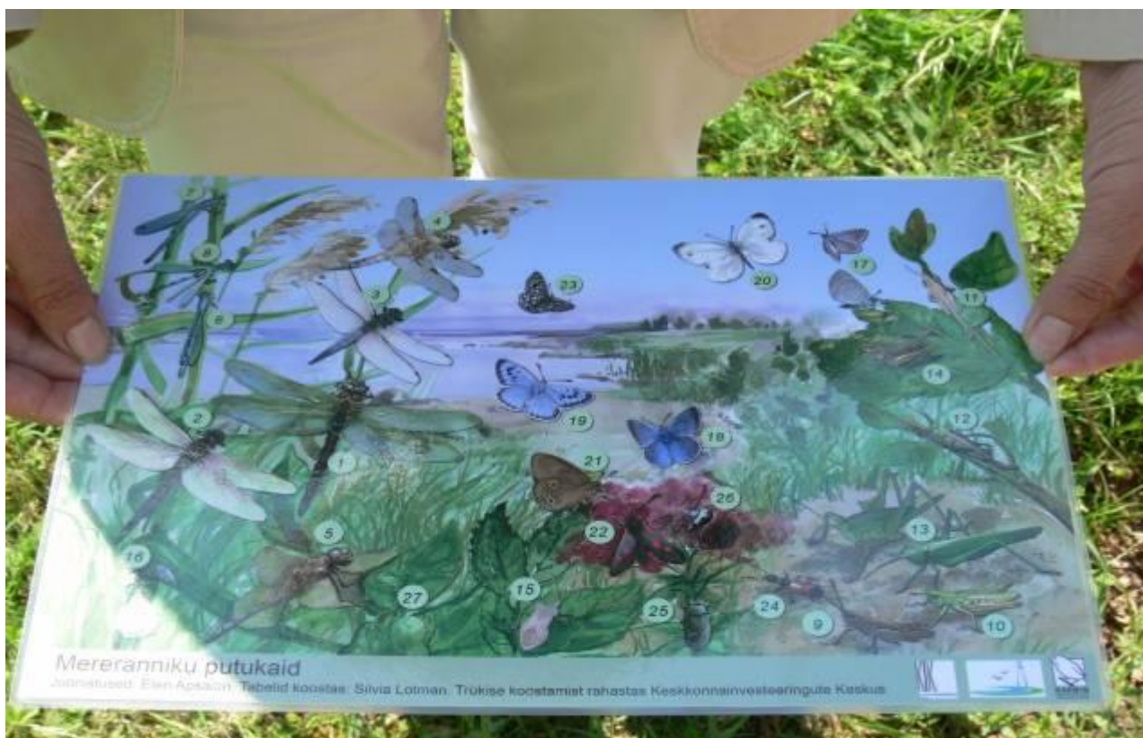
Joonis 16. Näitliku õppematerjali tutvustus, mida on võimalik kasutada väliõppes