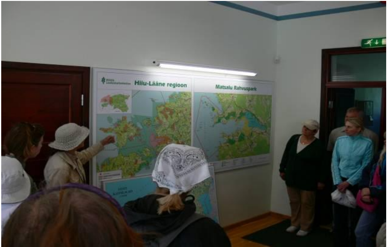
Joonis 3. RMK Matsalu teabepunkti ekspositsioon ja esmase ülevaate andmine