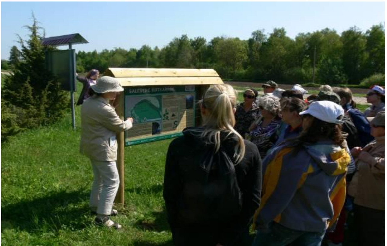
Joonis 23. Salevere matkaraja eeltutvustus ja viited tähelepanekuteks