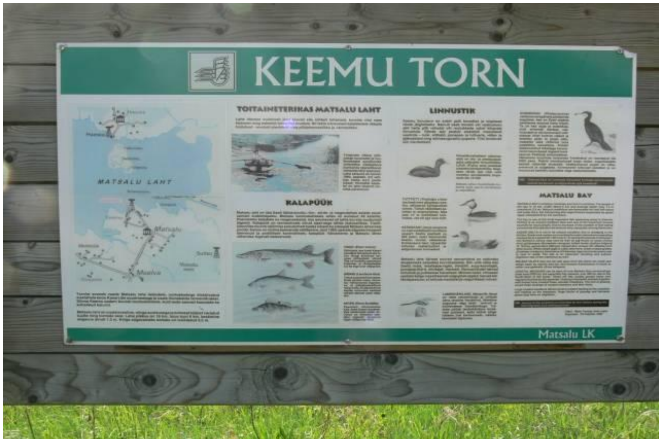
Joonis 27. Keemu vaatluskoht Matsalu lahele