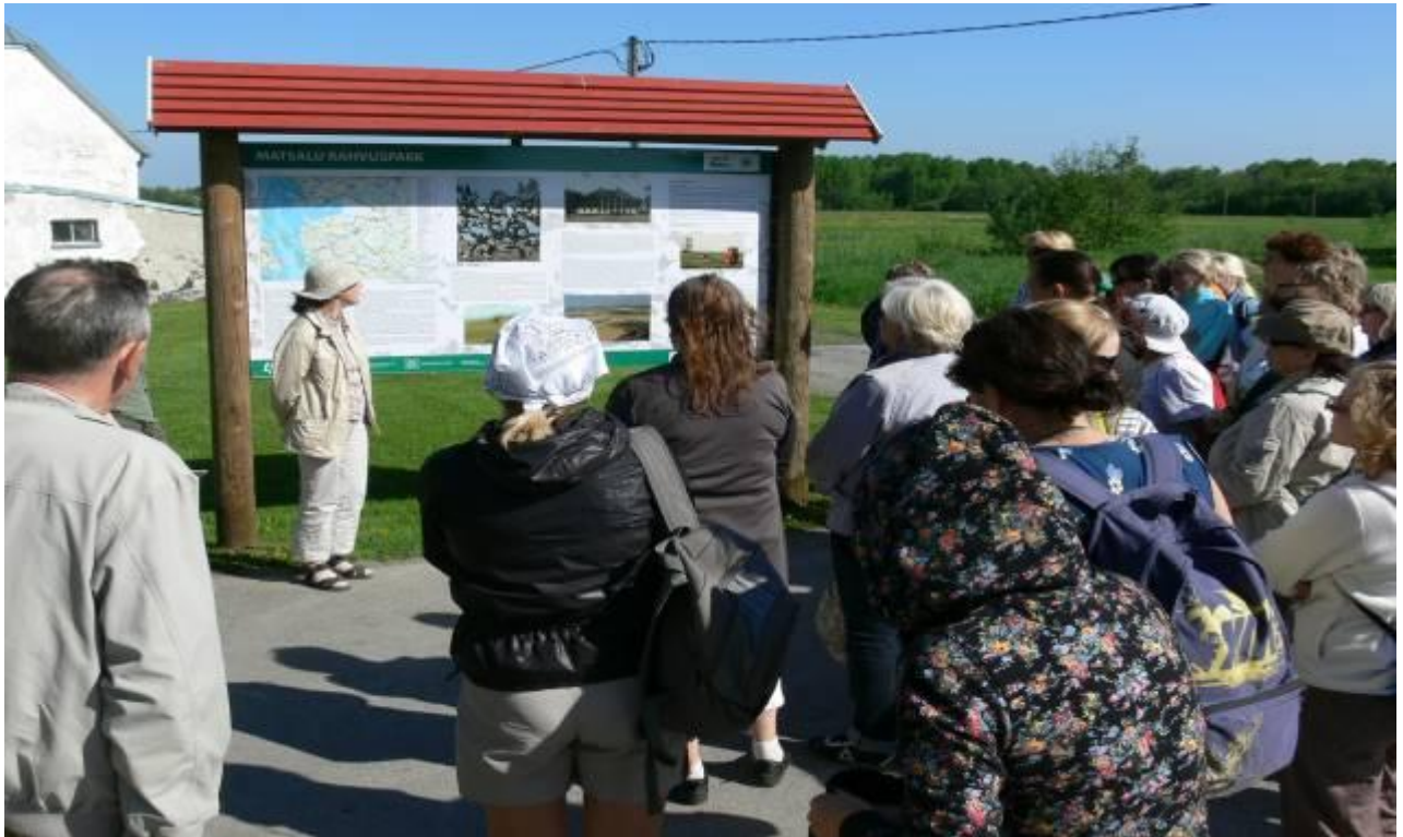
Joonis 1. Õppereisi algusena üldtutvustus Matsalu Rahvusparkist