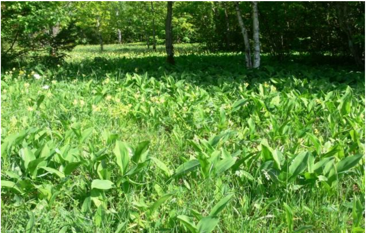
Joonis 26. Salevere taimestiku rikkus ja erilisus