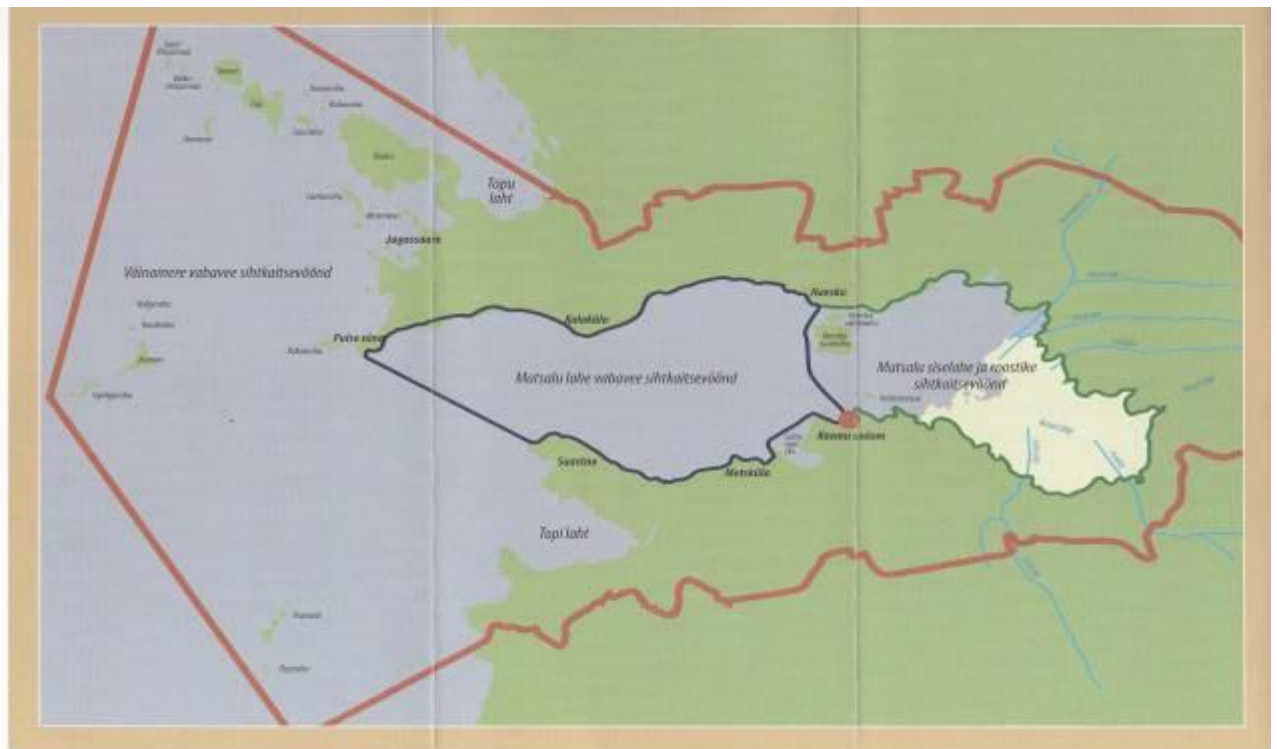
Joonis 2. Matsalu Rahvuspark