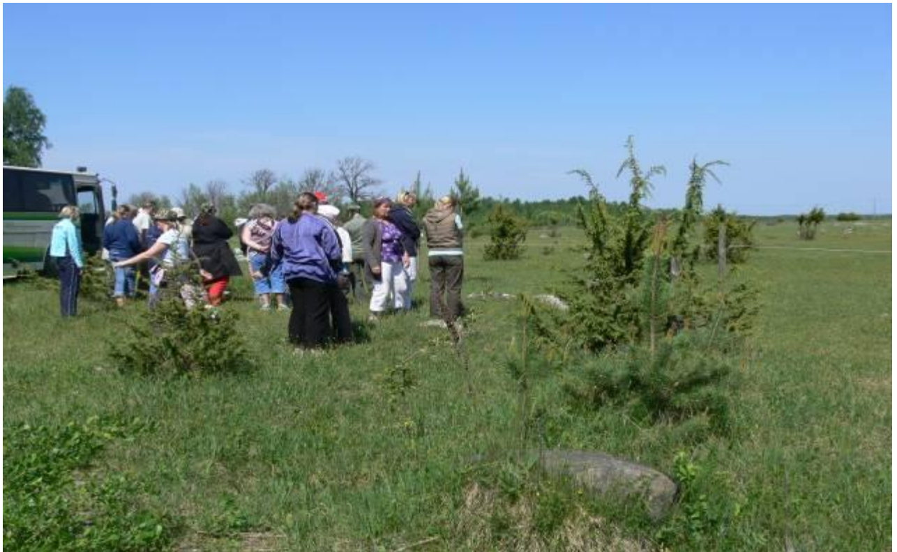
Joonis 12. Väliõppe praktiline loeng Viita puisniidul