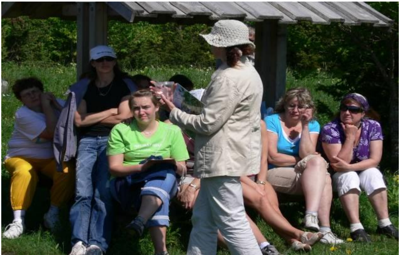
Joonis 19. Millised on võimalused ja kuidas kasutada lihtsaid vahendeid