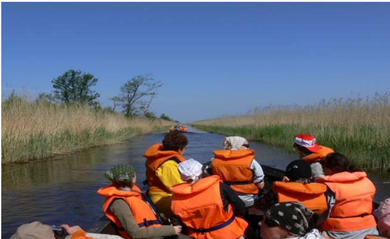
Joonis 9. Väliõppe jätk Kasari jõel