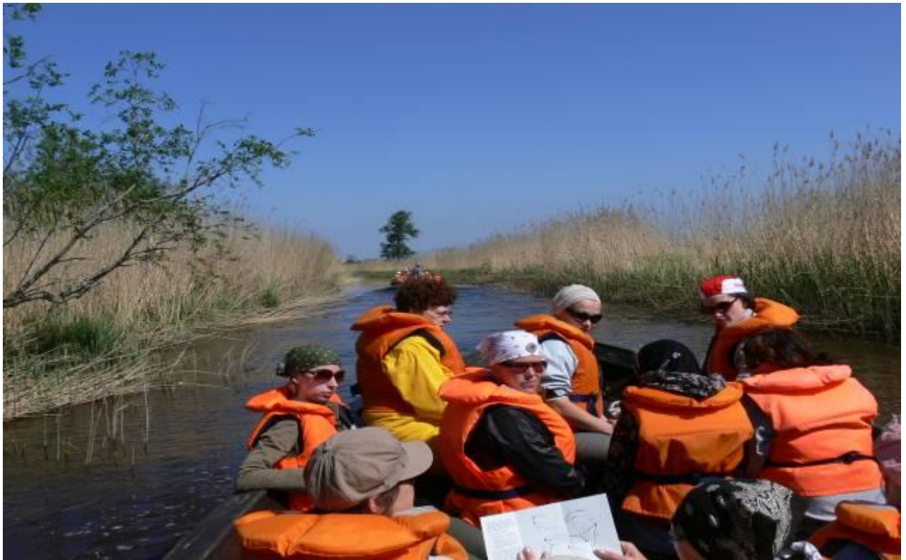
Joonis 7. Veel Suitsu jõel ja eespool suubumine Kasari jõkke