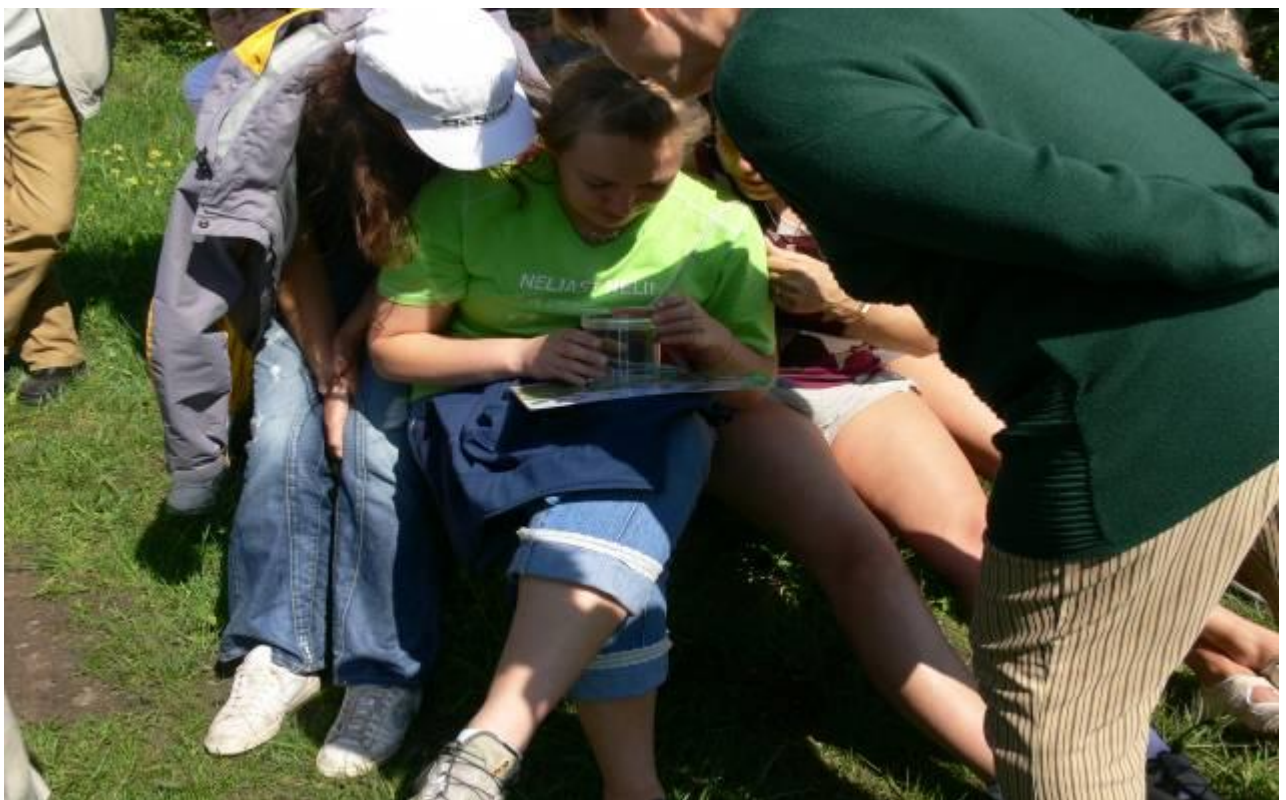
Joonis 20. Kuidas tutvuda putukatega