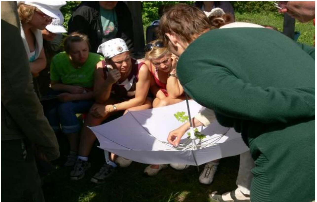
Joonis 22. Nii lihtne see ongi, vihmavari ja uurimisobjektid olemas