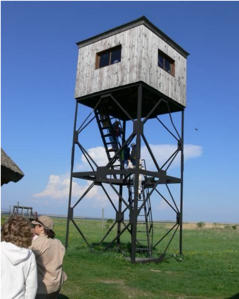
Joonis 28. Keemu linnuvaatlustorn

Õppereisi tulemusel said lasteaiaõpetajad ülevaate võimalustest õuesõppe korraldamiseks. Tähtsaimaks saab siin pidada Matsalu rahvusparki äärmiselt rikka looduskoosluse tundmaõppimisel paralleelide leidmise oskus edaspidiseks õuesõppe korraldamiseks juba oma kodukoha looduskeskkonda kasutades. Lisaks oli praktilise õppe käigus võimalik tutvuda lihtsate abimaterjalide ja tehniliste lahendustega, mis omavad suurt tähtsust teadmiste ja oskuste viimisel lasteni.