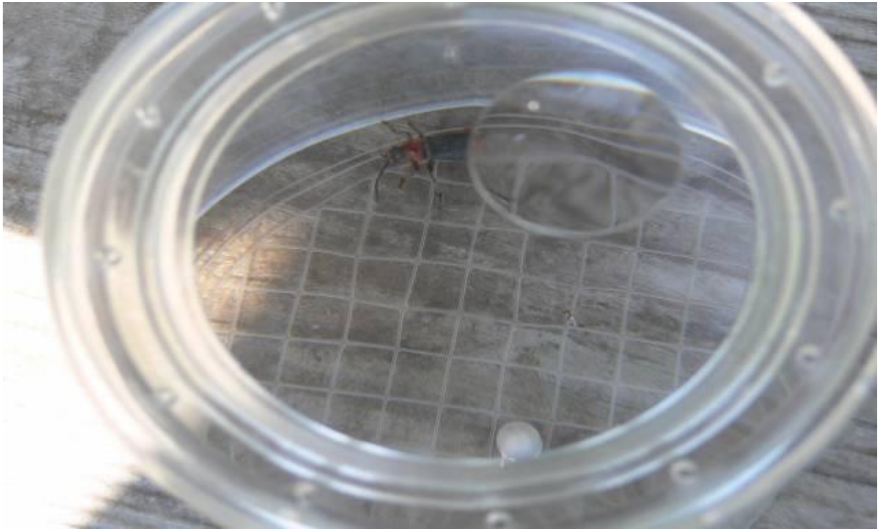
Joonis 21. Lihtne ja huvitav abivahend putukatega tutvumiseks