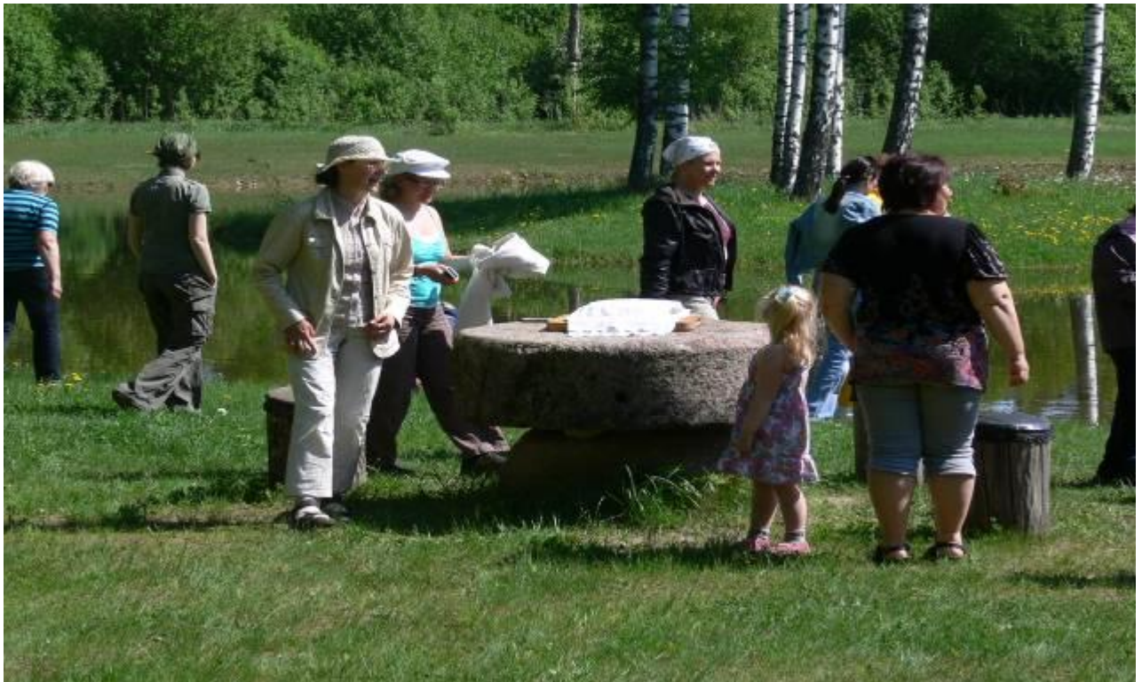
Joonis 14. ..... kohaliku talu igapäeva elu ja oluga (kultuuripärand, võimalused, toodang jne)