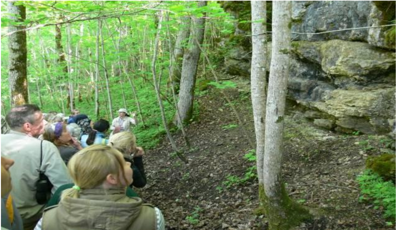
Joonis 25. Salevere maastikuline omapära